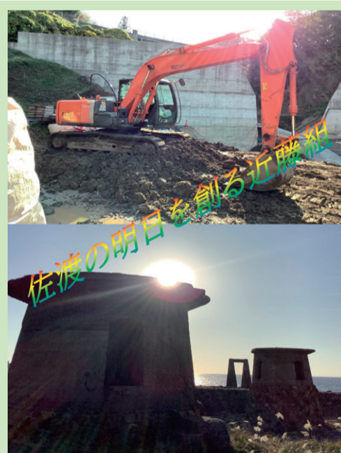
相川中学校の生徒の皆さんによるポスター